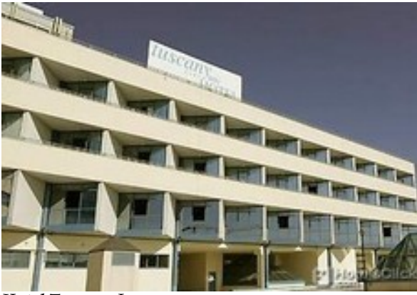
Hotel Tuscany Inn